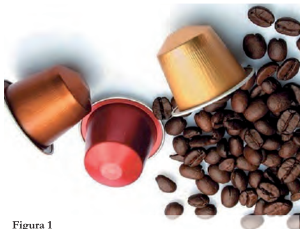
Figura 1 Nespresso caffè – Capsule in alluminio.

Il programma, attivo in Italia dal 2011 e rinnovato nel 2014, grazie ad un accordo siglato fra Nespresso, CiAl, Federambiente e il CIC (Consorzio italiano Compostatori), prevede che le capsule riconsegnate dai cittadini in 36 boutique Nespresso e 46 isole ecologiche su tutto il