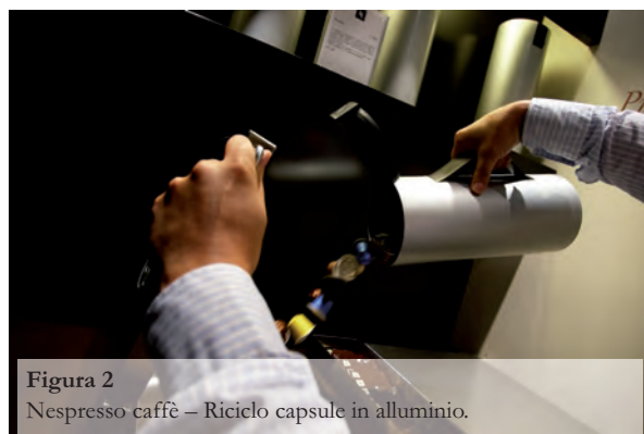
Figura 2 Nespresso caffè – Riciclo capsule in alluminio.

territorio nazionale siano raccolte e trattate per separare l'alluminio e il caffè residuo, avviando i due materiali a distinti processi di valorizzazione: