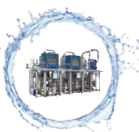
ECO DPM SE